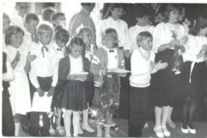
Dzieci przygotowały program artystyczny