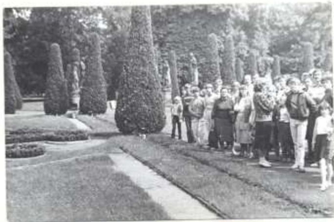
W parku tytykowskim