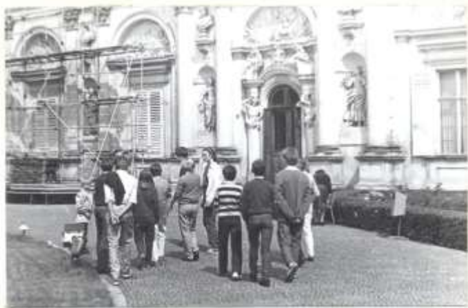
Wilanów w trakcie remontu