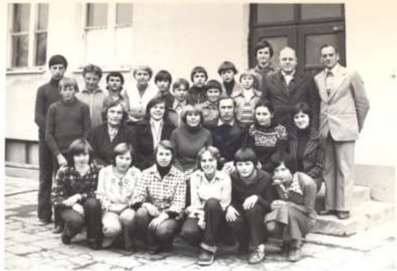
Grono pedagogiczne pracownicy obsługi i uczniowie kl. VIII w toku szkolnym 1979/80