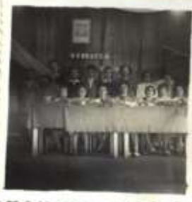
Lechoja i kłania III