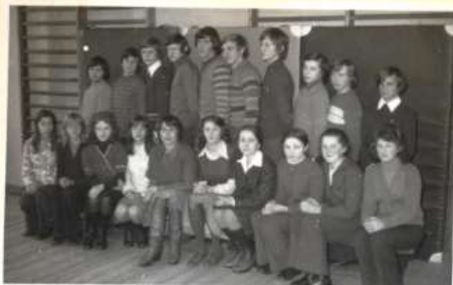
Absolwenci kl. VIII w roku szkolnym 1976/77