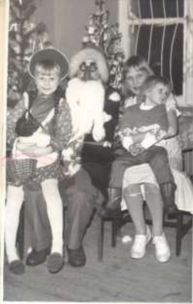
Migawki z choinki noworocznej