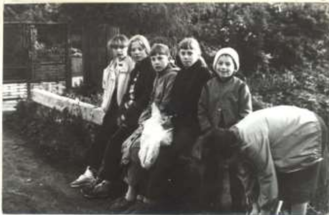
Zmiana obuwia w Zosińce Ma- łej po zejściu z Lubogoszczy