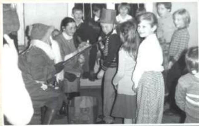
Zabawa noworoczna styczni 1983r.

W miesiącu styczniu 1983r. odbyła się w szkole zabawa noworoczna v której wzięli udział wszyscy uczniowie.