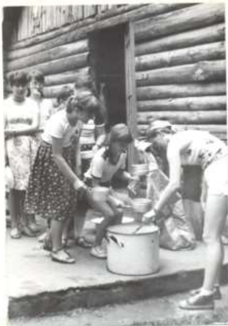
Biwak nad jez. Zbiczno