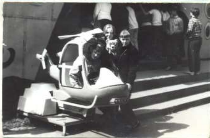
W chorzowskim parku kultury i wypoczynku