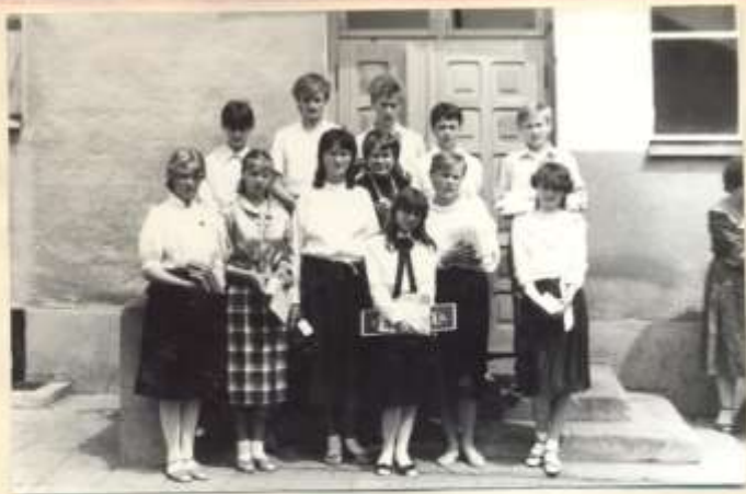
kl. VIII w dniu zakończenia nauki szkolnej