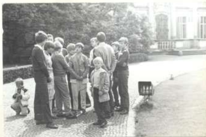
W czasie zjedzenia kilanowa