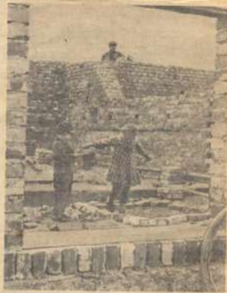
Roboty w Zamościu Roboty w Kaniowie

przy poparciu władz gromadz- kich powiatowych i wojewódzkich. Wskroś ten causa inijatywa miubanków wspomnianych wsi uzyskała poparcie nielicznej grupy cywilików i sprawa budowy szkoły w Gaju stała się realna. Do komitetu budowy szkoły powołano najaktywniejszych obywateli. O zainteresowaniu budową szkoły w Gaju mówi Świadny fakt, że relikwi dr. Izabela zsi Francuskiej dowosił 6,156 ziemi ze swoich gruntów na plac pod budowę. Pora tyż zademonstrowali w ramach cyfry spontanicznego dążeń miubanków;