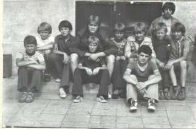
Wakacje 1979 t.